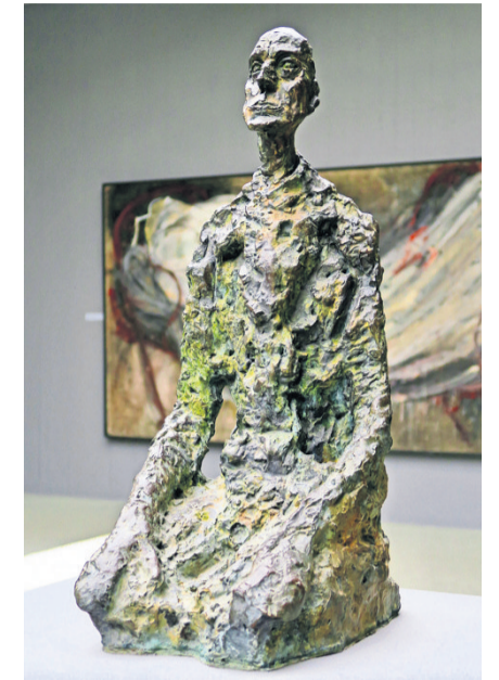
Skulptur von Giacometti

Der 2024 fertiggestellte Themenweg Sentiero Giacometti führt auch nach Borgonovo. In dem winzigen Dorf erblickte Alberto Giacometti, der bereits in den 1960er Jahren mit Retrospektiven in London und New York geehrt wurde, 1901 das Licht der Welt. Sein Geburtshaus liegt in der engen Hauptgasse.