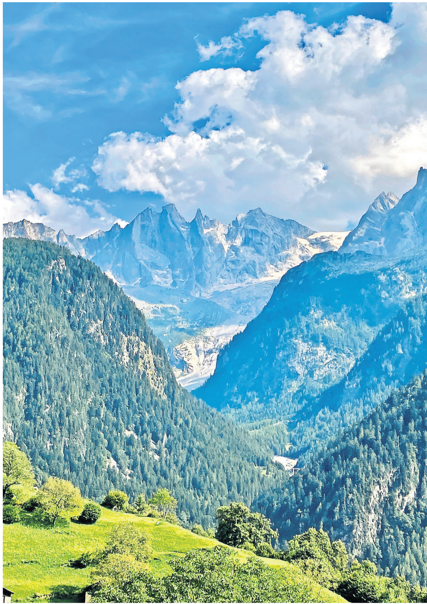
Spektakulärer Blick auf die Bergwelt des Oberengadins